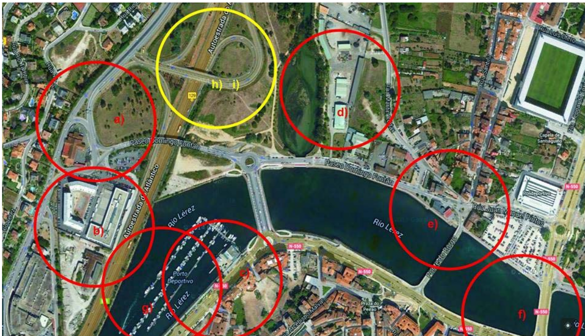
Agresións ao Río Lérez na súa desembocadura: a) Enlace da Autoestrada b) Edificio da Garda Civil c) Porto deportivo d) Naves das administracións e) Gasolineira e edificios do Burgo f) Verteduras directas g) Cocheiras de Ministerio de Fomento Perigos inminentes (en amarelo): h) Polígono comercial i) Ampliación da estrada de Vilagarcía