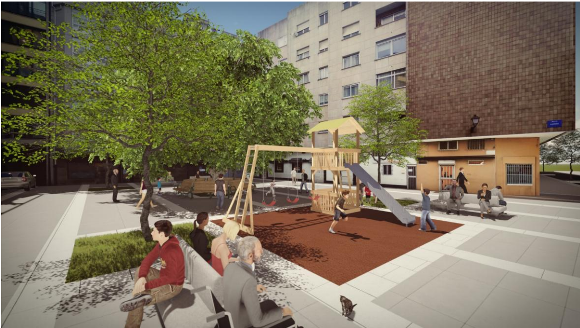
Vista panorámica da praza da Castaña (proposta Marea)

A necesaria rectificación de algo mal feito leva a MAREA PONTEVEDRA a presentar a seguinte PROPOSICIÓN