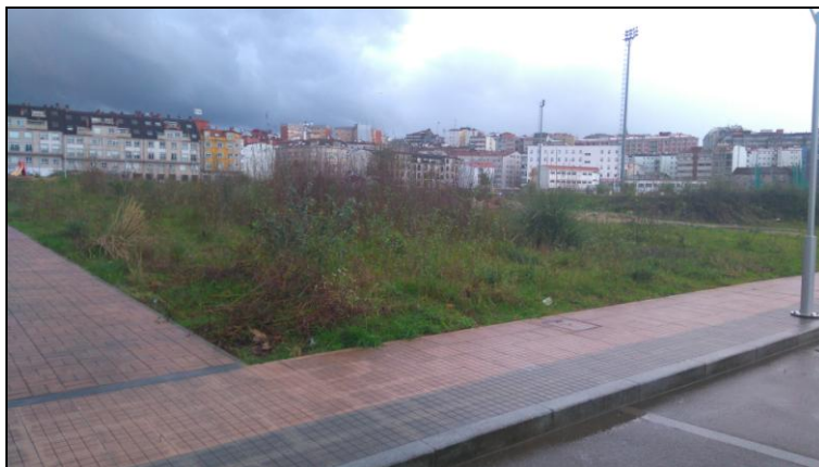
Parcela ubicada en Tafisa, 3.109 m 2