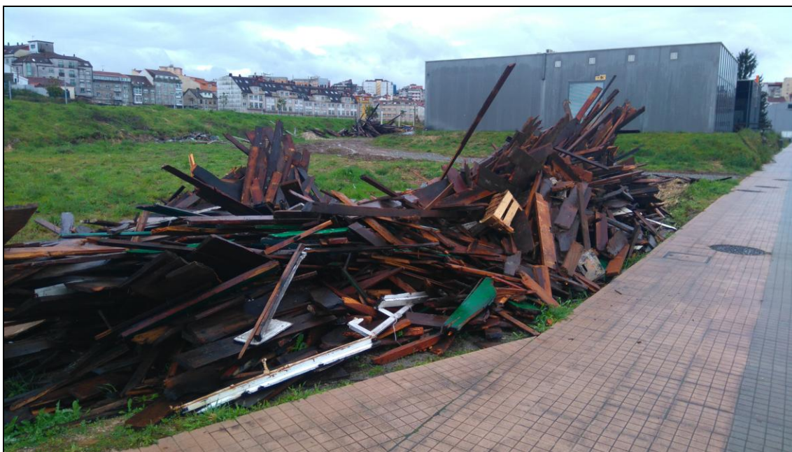
Parcela ubicada en Tafisa, 3.725 m 2