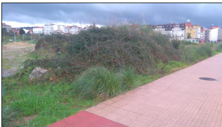
Parcela ubicada en Tafisa, 3.055 m 2