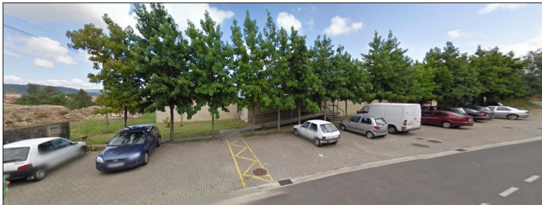
Centro de Saúde Monteporreiro