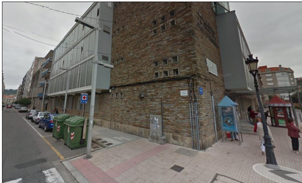
Centro de Saúde Virxen Peregrina

“Tarjetas de estacionamiento autorizado” nas prazas de servizos de emerxencias no Centro de Saúde Virxe Peregrina.