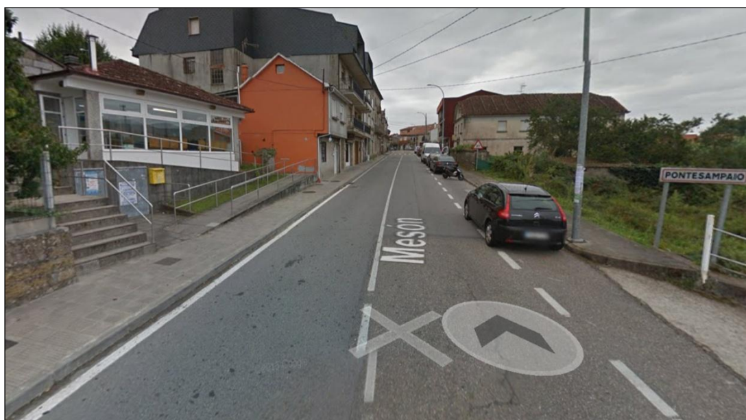
Centro de Saúde Pontesampaio.

No Centro de Saúde de Pontesampaio , non se dispón de praza específica para o estacionamento das ambulancias, algo que non se contemplou na última reforma da vía, e na actualidade condicionado polas condicións da vía, nin de ningún tipo de sinalización a tal efecto.