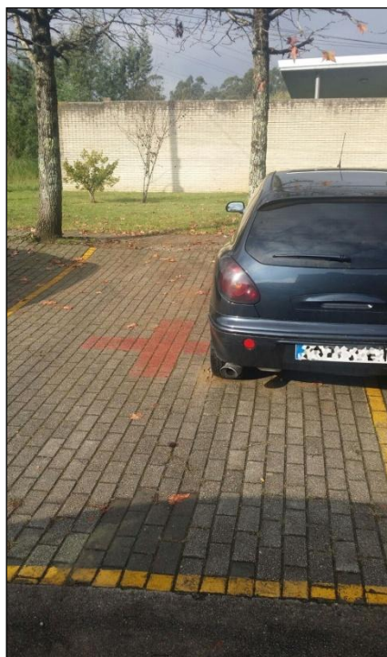
Centro de Saúde Monte Porreiro