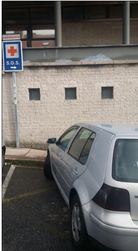
Centro de Saúde Lérez

2,40 m que precisan para poder baixar a padiola e manobrar, fan un total de 9,10 m; é dicir que se estaciona a ambulancia na praza que lle corresponde invade un dos carrís da calzada xa que polo seu tamaño queda fóra de devandita sinalización, tanto pola lonxitude coma pola anchura. É necesario sinalar que este estacionamento atópase a beira dunha vía de dobre sentido de circulación co cal o volume de tráfico de vehículos e considerable, que xunto cun aparcamento privado que se atopa noutro lado da rúa fai que incremente a circulación de vehículos.