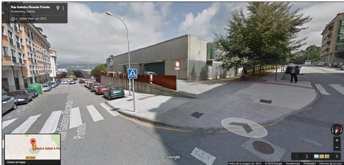
Centro de Atención Continuada PAC de A Parda

No Centro de Saúde Virxe Peregrina , as tres prazas existentes na rúa Echegarai indicadas para estacionamento dos vehículos de emerxencias están permanentemente ocupadas por vehículos particulares. Os cales teñen un cartel de “autorizados”: con membrete da Policía Local, sen cuño. Algo que desde Marea Pontevedra, podemos constatar en diversos días e a diferentes horas do día (véxase as seguintes fotografías).