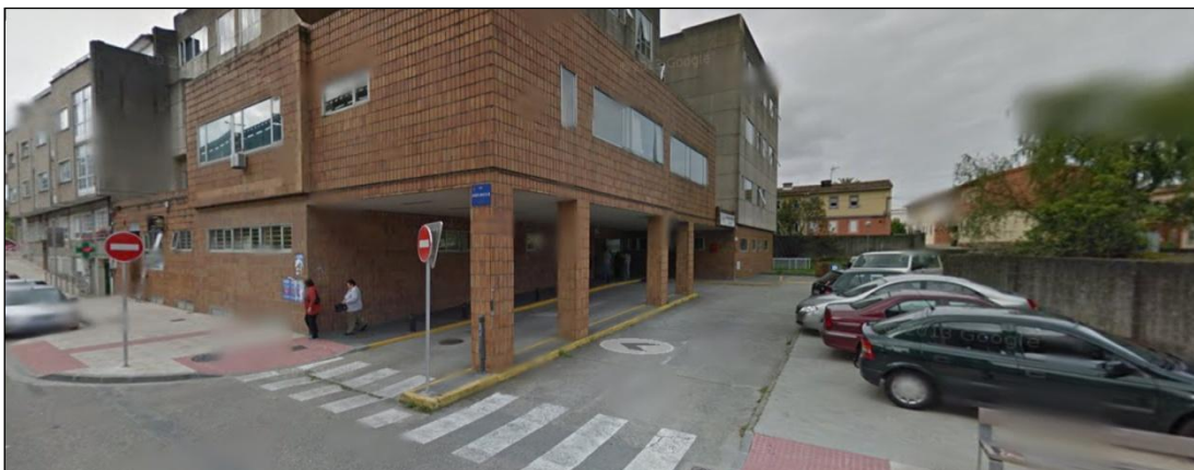
Centro de Especialidades de Mollabao

No Centro de Especialidades de Mollabao (Casa do Mar) , non existe praza destinada aos vehículos de emerxencias sanitarias, estacionan na parte interior do túnel existente e tampouco hai sinalización vertical nin horizontal a tal efecto.